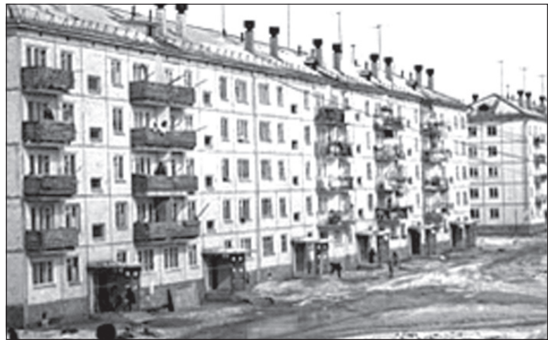
Многоквартирные жилые дома, называемые «хрущёвками».

После ухода из жизни Сталина на прошедшем под председательством Н.С. Хрущёва совместном заседании Пленума ЦК КПСС, Совмина и Президиума ВС СССР ему, как секретарю ЦК, было поручено право руководить работой Секретариата и председательствовать на заседаниях. Смещение в июне 1953 года со всех постов и арест Л.П. Берия, не без участия в этом деле Н.С. Хрущева, открыло ему дорогу к вождьленному высшему партийному посту. В движении к этой цели он по-