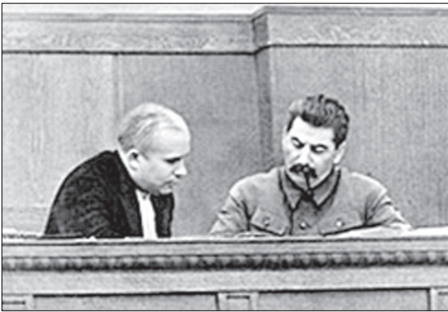
Сталин и Хрущев в президиуме сессии ЦИК СССР, январь 1936 года.

КОРНИЛОВ В. И. , первый секретарь ЯО КПРФ (1993 - 2000 гг.). Продолжение следует.