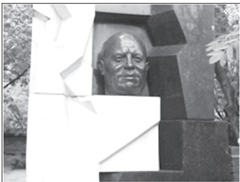
Надгробный памятник Н.С. Хрущеву (скульптор Э. Неизвестный).

15 апреля 1894 года родился Н.С. Хрущев. Вышедший из самых низов, не обладая серьезным образованием и политическим кругозором, тем не менее, за 6 лет, с момента постановки на партийный учет в Москве (1929 г.), он сделал головокружительную карьеру: почти от рядового коммуниста дорос до руководителя столичной партийной организации. В 1949 году - секретарь ЦК ВКП(б). Стал волею судьбы во главе страны в 1953 году. Его недостаточная образованность и волюнтаризм (нежелание советоваться с товарищами по партии и специалистами) подвели Н.С. Хрущева: себя дискредитировал.