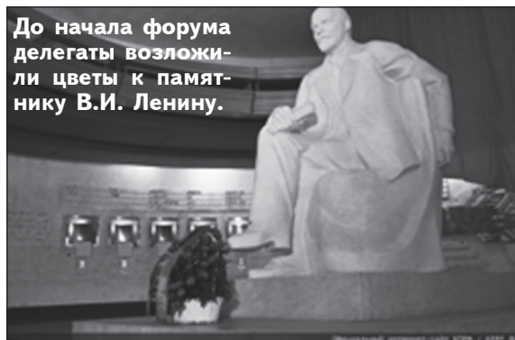
До начала форума делегаты возложили цветы к памятнику В.И. Ленину.