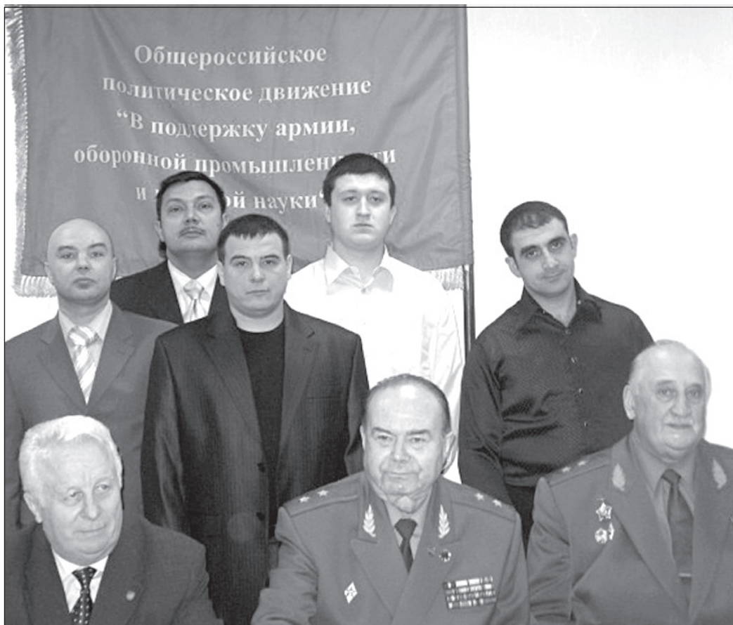
Участники X съезда Общероссийского общественного движения ДПА.

физических расправ с ее лидерами и участниками. Съезд предупреждает участников и сторонников ДПА о необходимости быть готовыми к более радикальным схваткам с действующим режимом, как в центре, так и на местах. Главной задачей ДПА в этих условиях должно стать объединение с реальной военно-патриотической оппозицией, на деле выступающей против режима, независимо от ее идеологических и политических воззрений, совместные действия по созданию единого всенародного Сопротивления с целью недопущения и