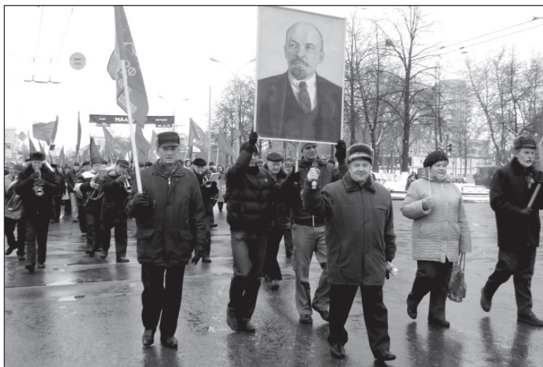
С именем Ленина. Колонна демонстрантов в Ярославле 7 ноября 2009 г.

(Отрывок из очерка М. Горького «В.И. Ленин» публикуется в сокращении).