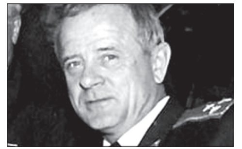
Женат, четверо детей, двое внуков. Оправдан судом присяжных по обвинению в покушении на Чубайса. В настоящее время по данному обвинению повторно проводится четвертое судебное заседание. Начальник объединённого штаба Народного ополчения имени Минина и Пожарского, член Высшего Совета Офицерского собрания России.

С 1994 года - на ответственной должности в Главном разведуправлении. С 1999 года - ведущий научный сотрудник Центра военно-стратегических исследований Генерального штаба. Кандидат военных наук. К защите представлена докторская работа по теории специальных действий Вооружённых Сил Российской Федерации в современных условиях. Участник рабочей группы министерства обороны Республики Беларусь и Российской Федерации по унификации законодательства в области обороны.