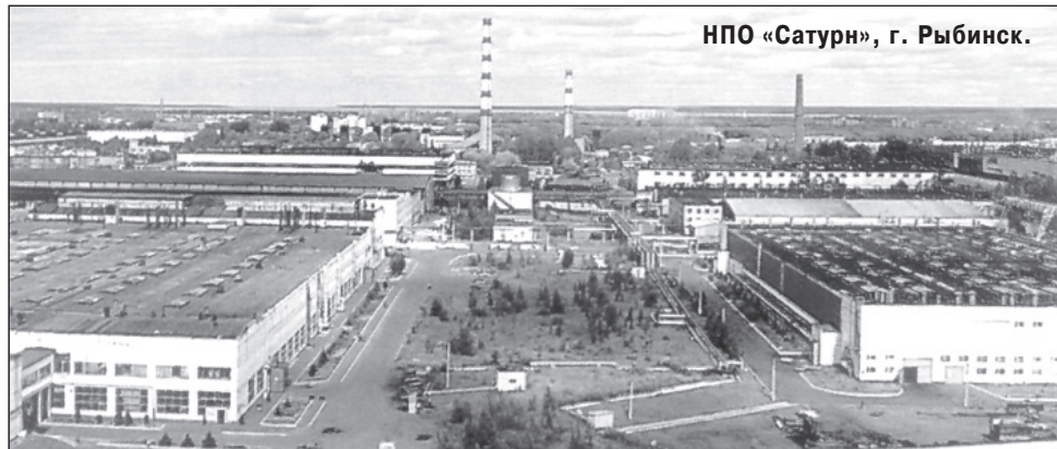
НПО «Сатурн», г. Рыбинск.

кой на исторический опыт советского народа. Цитата: «Неграмотная страна была превращена в одну из самых влиятельных по тем временам индустриальную державу». В то же время смысловое содержание послания не побуждает «прежде думать о Родине, а потом о себе». Приоритет по-прежнему отдается конкурентной борьбе и частной инициативе, даже в стратегических отраслях экономики.