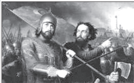
Дмитрий Пожарский и Кузьма Минин.

30 октября 1578 года родился Дмитрий Пожарский, национальный герой России, военный деятель.