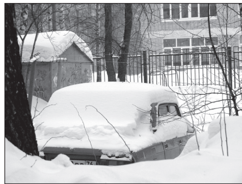
Жаль, что не амфибия.

Я поймал себя на «крамольной» мысли, что «никто не даст нам избавленья...», если горожане сами не захотят заставить власть и управляющих домовых компаний хорошо работать.