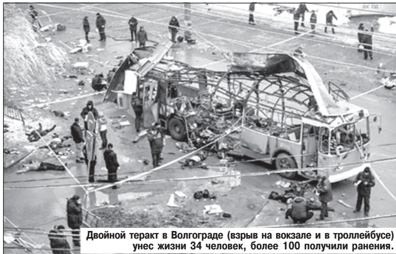
Двойной теракт в Волгограде (взрыв на вокзале и в троллейбусе) унес жизни 34 человек, более 100 получили ранения.