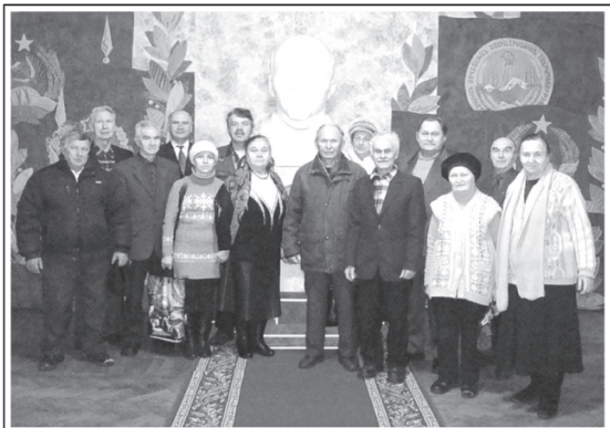
Партийный актив Рыбинского ГК КПРФ в музее «Советской эпохи»

В декабре 2013 года, отмечая день рождения И.В.Сталина, партийный актив Рыбинского городского отделения КПРФ посетил музей «Советской эпохи». Он входит в состав Музейно-паркового комплекса «Советская эпоха», включающего экспозицию социалистического быта в Доме культуры и окружающий парк, в котором будут размещены ряд памятников и гипсовых скульптур, сохранившиеся в рыбинских парках и скверах с 30 — 50-х годов прошлого века. После реставрации скульптуры станут частью экспозиции парка скульптур советского времени "Символы Советской эпохи".