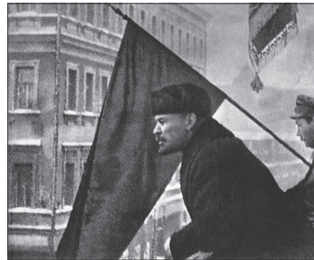
В.И. Ленин выступает на Красной площади в Москве.