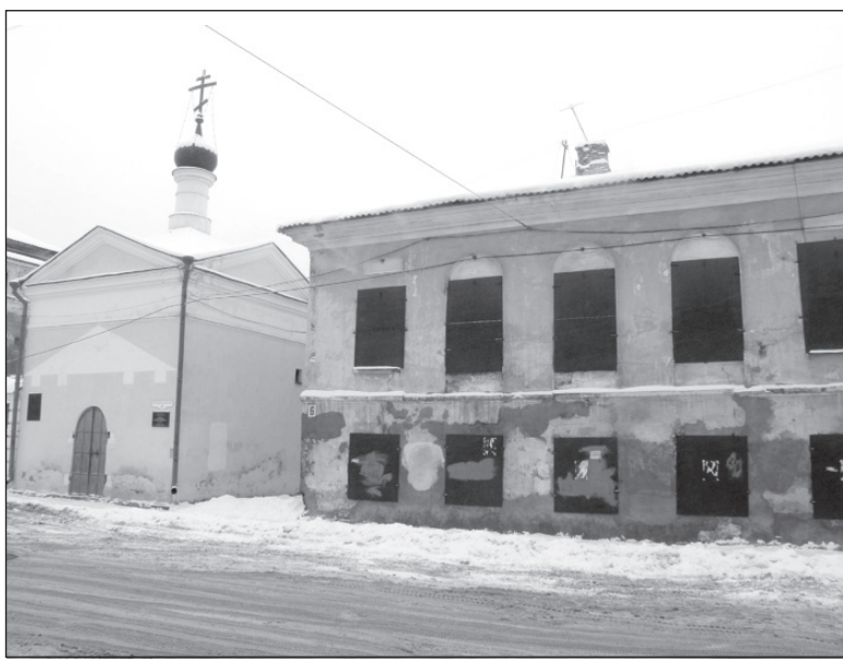
Дом Тюменевой в самом центре Рыбинска.

Да, дом расселить не мешало бы давно, не ахти там проживало и народу. Из восьми квартир шесть были в муниципальной собственности, две приватизированы. Вроде бы из той переписки было понятно, что область дом себе на баланс взять готова, город жаждет отдать все и безвозмездно, да только во что все упи-