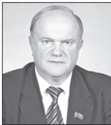
ЗЮГАНОВ Геннадий Андреевич, Председатель ЦК КПРФ, руководитель фракции КПРФ в Госдуме ФС РФ.

Президент Путин на исходе года выступил с посланием Федеральному собранию, которое фактически является обращением ко всей стране. Кроме того, он провёл традиционную встречу с журналистами, представляющими различные российские регионы, и ответил на их вопросы. Но даже самые злободневные из поднятых на этой встрече тем почти не касались глубинных проблем страны, вопросов её государственной безопасности.