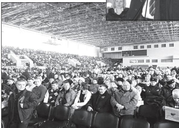
Олег Царёв выступает перед харьковчанами.

встает на защиту страны! ...Вообще-то они зря сюда, на Юго-Восток, приехали. Харьковчане молодцы — победили эту заразу на взлете. А в Запорожье, Днепре пришлось побороться. Я читал их пере-