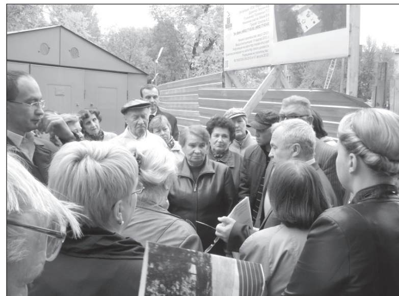
Сход жителей дома №27, протестующих против строительства дома в их дворе.

А в Ярославле опасная ситуация сложилась со стройкой 14-этажного дома высотой 47 метров по улице Советской, во дворе дома 69. Строительство дома ведет ООО «Строительная компания «НТМ» на земельном участ-