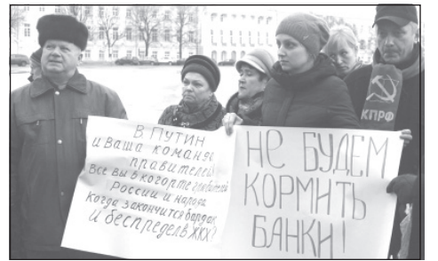
18 февраля перед заседанием Ярославской областной Думы состоялся пикет граждан.