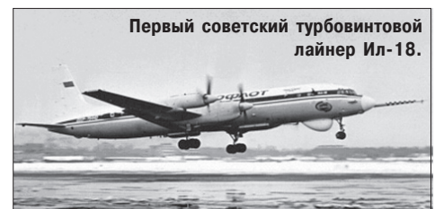
Первый советский турбовинтовой лайнер Ил-18.