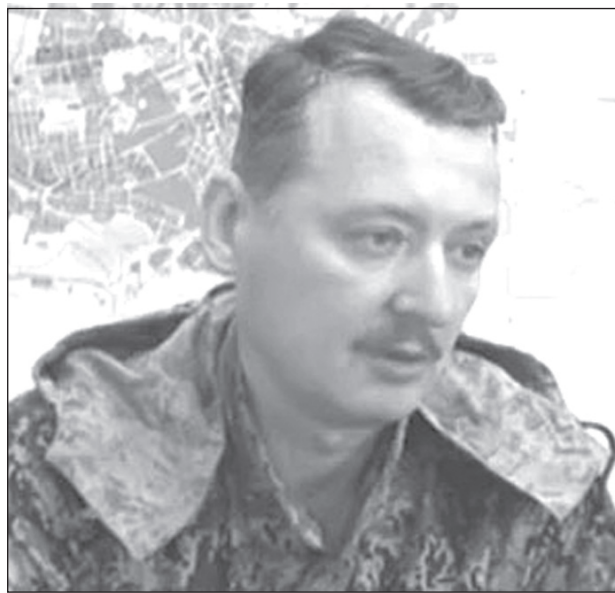
Игорь Стрелков: «Если Москва не вмешается, отряды самообороны не смогут противостоять украинской армии».

Даже несколько тысяч ополченцев, которые сосредоточены сейчас вдоль границы, с несколькими танками, несколькими орудиями, пусть с большим количеством пулеметов и гранатометов все равно не смогут долго противостоять авиации, артиллерии, массе танков. Соотношение танков может оцениваться 1 к 500, БМП - 1 к 300, 1 к 800 - артиллерия, про авиацию я молчу. Пройдет неделя, две, три, может быть месяц, самые боеспособные части ополчения будут обескровлены и рано или поздно разбиты и уничтожены. Вот что нас ждет. (Окончание на стр.3.)