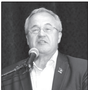
Выступает А.В. Воробьев.

В связи с событиями, развернувшимися на украинской земле, Центральный комитет выступил с заявлением «Нет олигархической диктатуре на Украине!»