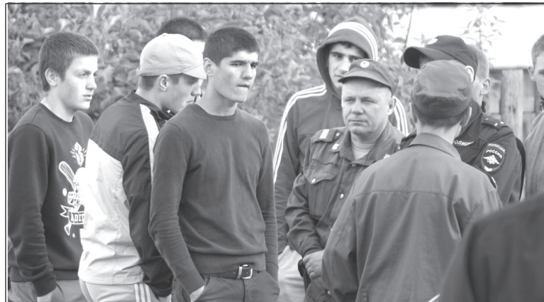
Молодые люди, привезённые полицией, чтобы изображать представителей общественности.

Через час должны были состояться слушания с соседним селе Большая Дора. Власти планировали провести их по той же схеме, что и в Суде: у входа стояли охранники, не позволявшие людям войти, на заседание пускали только по неизвестно кем утверждённым спискам. Охранники заявляли: «не пытайтесь список развернуть или подглядеть, что там написано». Неизвестные молодые люди,