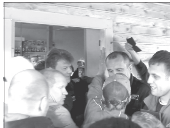
Деревня Большая Дора. Жителей также пытаются не пустить.

В итоге, когда дело дошло до голосования по вопросу изменения границ поселения, «за» проголосовало только трое, включая главу поселения, «против» - все остальные присутствующие, т.е. около ста человек. И хотя власти отказались внести результаты народного голосования в протокол и