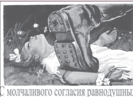
С молчаливого согласия равнодушных

СЕВЕРНЫЙ БАНК СБЕРБАНКА РОССИИ ОТДЕЛЕНИЕ N17 СБЕРБАНКА РОССИИ ИНН 7707083893 КПП 760402001 БИК 047888670 КОРП. СЧЕТ 30101810500000000670 ЛИЦЕВОЙ СЧЕТ \\\ 40817810377030137337