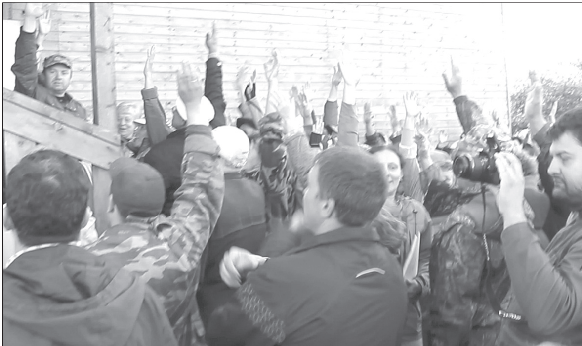
Голосование против - руки поднимают практически все присутствующие.