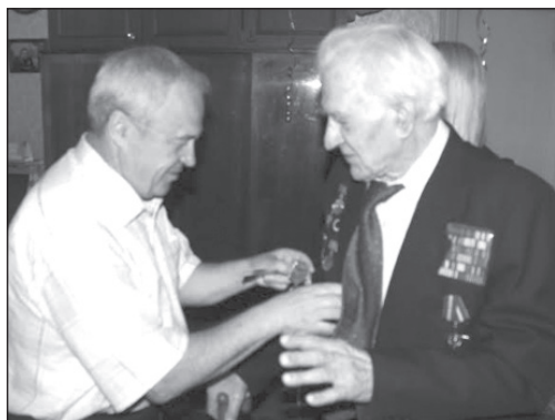
чил юбиляру партийную медаль «70 лет Сталинградской победы» (на фото).