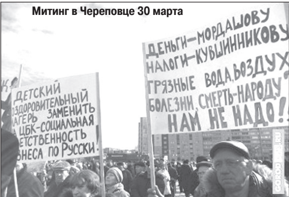
Митинг в Череповце 30 марта

17 июня администрация сельского поселения провела в посёлке Суда и деревне Большая Дора по этому вопросу «общественные слушания». Называть их так можно только в кавычках, поскольку властью были приняты все меры для того, чтобы не позволить населению принять в них участие. Накануне по квартирам были разнесены листовки, содержащие дезинформацию: сообщалось, что слушания пройдут 18 июня, в то время как в действительности их дату никто не переносил. Тем не менее, большинство людей не «купились» на это и пришли вовремя. Однако, на слушания их не пустили.