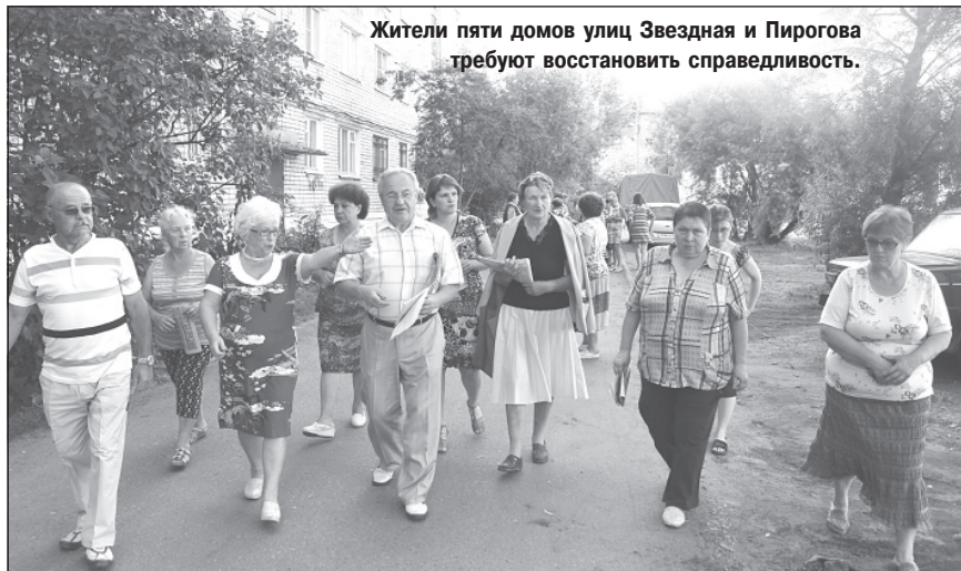
Жители пяти домов улиц Звездная и Пирогова требуют восстановить справедливость.

Опрос общественного мнения, проведенный городским центром ЦИОМСИ, показал, что большое количество жителей выступили против этой стройки. Но новый дом построили. Только двор с детской и спортивной площадками общими не стали.