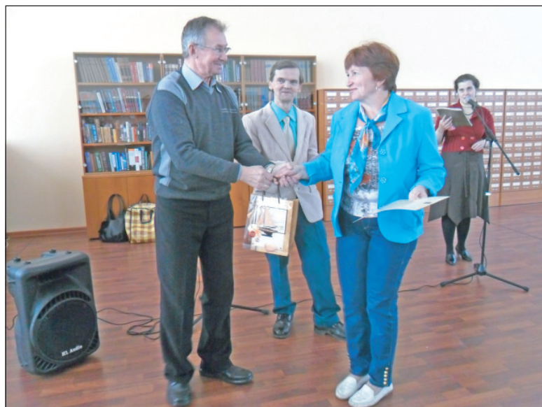
Награждение победителей конкурса.

Полномочный представитель ярославского отделения Союза писателей