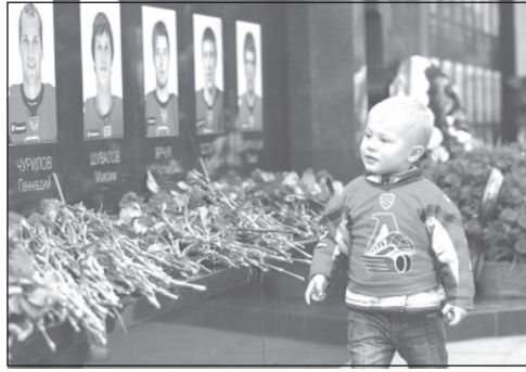
Шли в авиакатастрофе 7 сентября 2011 года.