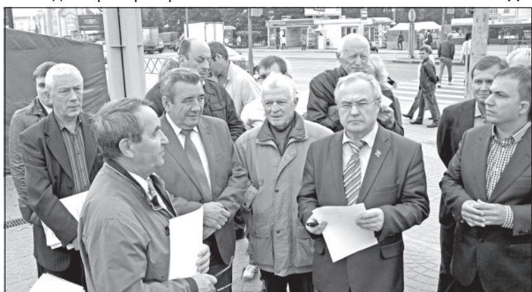
9 сентября депутаты и общественники вновь проинспектировали реконструкцию улицы Свободы в Ярославле.