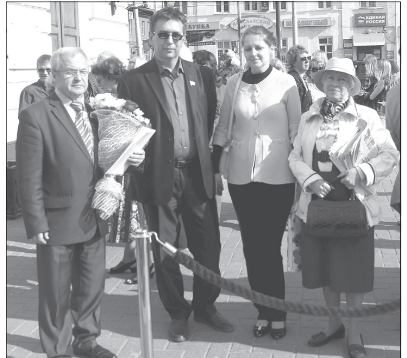
Ярославские коммунисты перед празднованием юбилея.

Президент Республики Беларусь А.Г.Лукашенко.