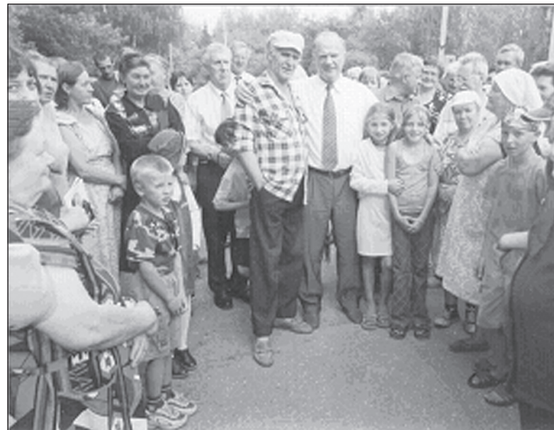
Г.А.Зюганов в Горках на праздновании 40-летия музея.

Киселев с помощником красили ее по вечерам (приезжал после работы из Переславля). Привезли бочку краски из Ярославля, красили фасад дома... Музей стряхнул пере-