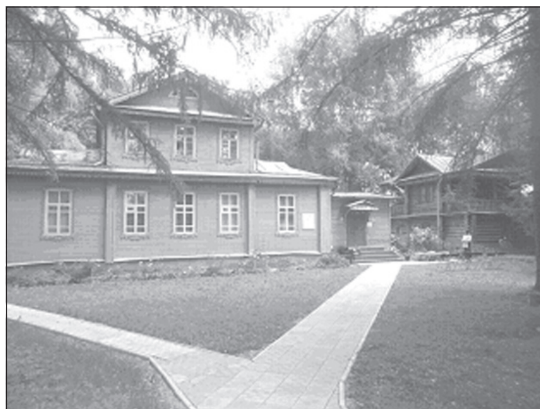
Музей Ленина в Горках.

Начальственный негодующий окрик «кто разрешил?!» и указующий перст я встретила подготовленной. Объяснила, что проект разработан на основе воспоминаний членов семьи