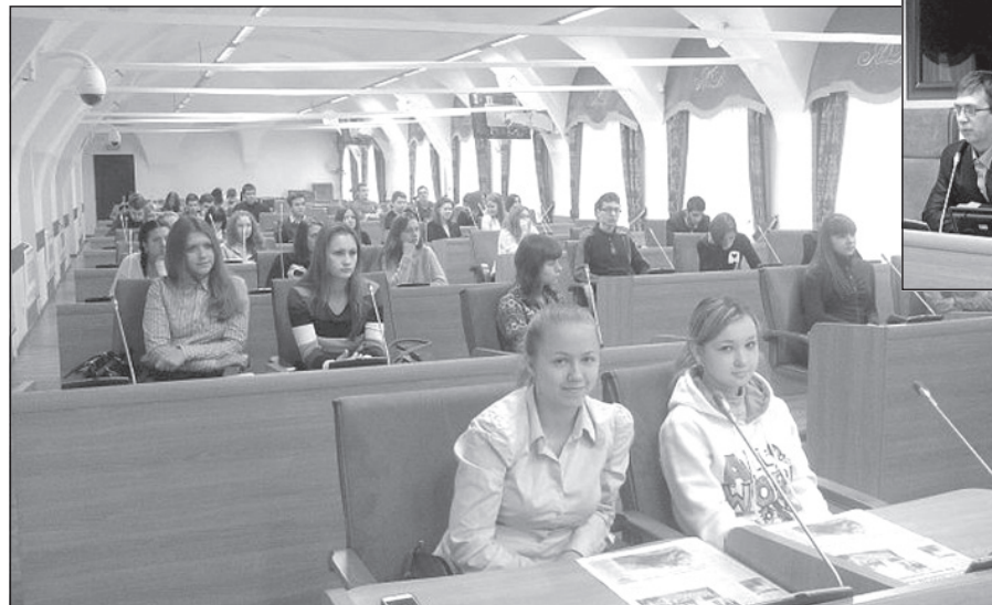
Студенты Ярославского техникума управления и профессиональных технологий.