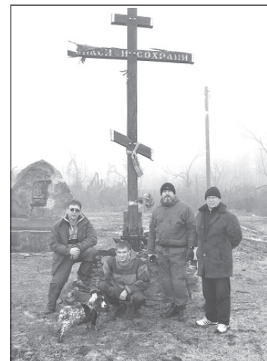
У посёлка Чернухино.

- А почему с территории Украины машины не проходят?