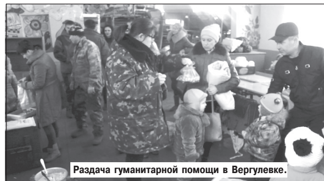
Раздача гуманитарной помощи в Вергулевке.