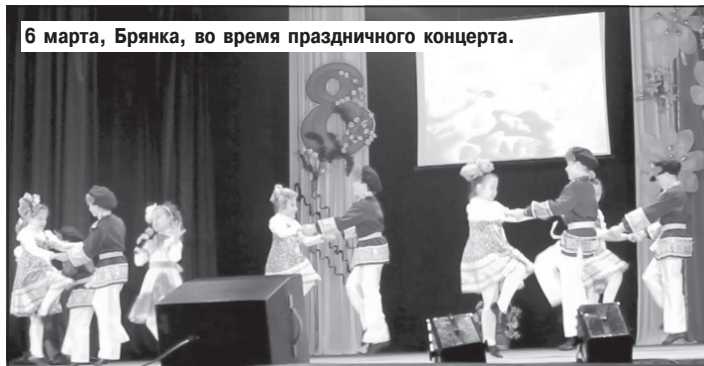
6 марта, Брянка, во время праздничного концерта.