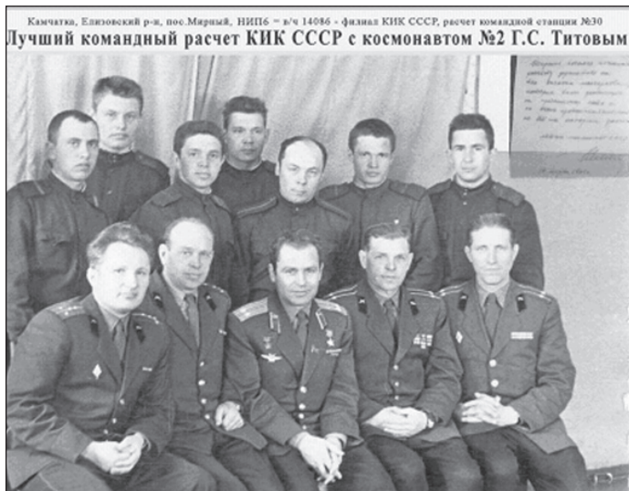
Камчатка, Елизовский р-н, пос. Мирный, НИИПБ - №14086 - филиал КНКС СССР, расчет командной станции №30 Лучший командный расчет КНКС СССР с космонавтом №2 Г.С. Титовым

Чтобы остановить превосходящего по ударным ядерным средствам противника, к 22 октября 1962 года воины СССР осуществили героическую морскую операцию, скрытно доставив ядерные ракеты с обслуживающим составом на Кубу для защиты Кубинской революции и для создания неотвратимости ядерного удара по США в случае их нападения на СССР или на Кубу.