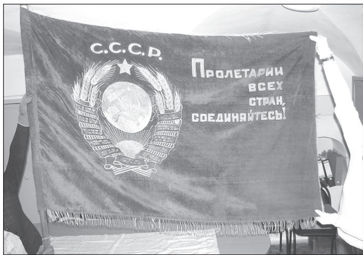
Знамя, врученное ярославским пионерам.

кая пляска», «Кружочек», «Шалунишки». Из стихов: «Я у зеркала хожу», «Письмо, вложенное в посылку», «Сашка» и многие другие патристические стихотворения, песни, частушки.