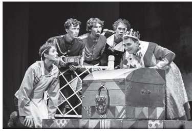
Сцена из спектакля «Русский секрет».

Шутки-дрючки начались с первых шагов. Больную жену Иванова помещали в стеклянный куб. Потом этот куб закрывали брезентом, по ходу спектакля куб вообще переворачивали. Зачем, непонятно! Сцена большая, но актерам как будто места не хватает - бегают перед рампой. Было шумно, и за шумом терялся смысл пьесы Чехова. Не читая пьесу, понять ее содержание по ходу спектакля практически невозможно было и прилежному зрителю. Добрая половина текста была режиссером выкинута за ненадобностью, но отдельные фразы: «адвокаты грабят, а доктора еще и убивают» - повторяли раз пять. Право же, весьма утомительно, хотя в зале и раздавались одинокие смешки.