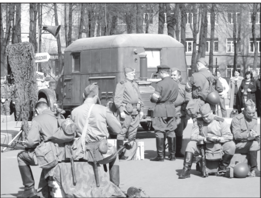
Бойцы 1945-го выглядели так.