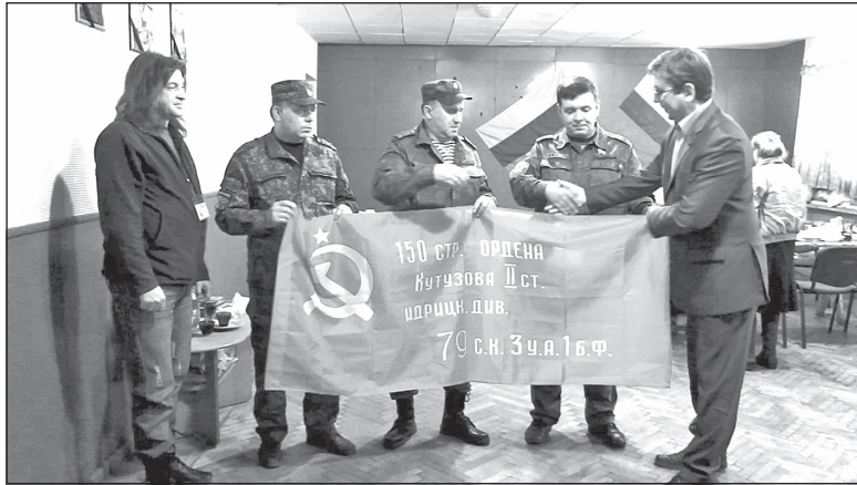
Знамя Победы. Город Брянка.

нынешними неонацистами, которые год назад, к большому сожалению, подняли голову на братской Украине.