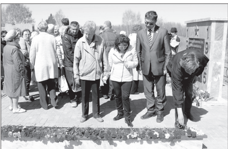
Памятник погибшим в годы Великой Отечественной войны открыт в Парково (Ярославль).