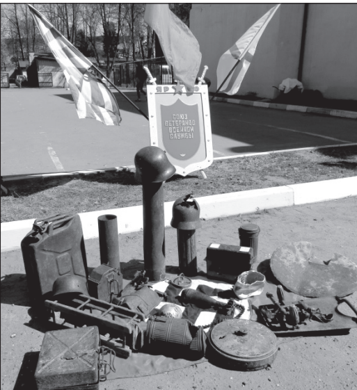
Все, что осталось от поработителей-гитлеровцев на нашей земле.