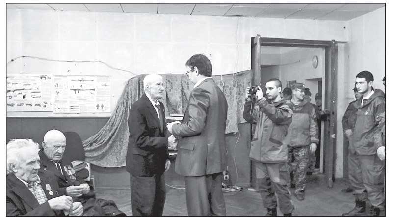
Вручение медалей. Город Брянка.

Командатура города Брянка, куда мы привезли копии Знамени Победы, устроила для своих ветеранов настоящий праздник. На встречу пришли девять пожилых людей, притом самому молодому из них было 92 года, а самому старшему – 101! Ну, когда ещё получится пообщаться с такими людьми! Мы вручили им юбилейные медали, продуктовые наборы. После этого тепло побеседовали за праздничным столом.