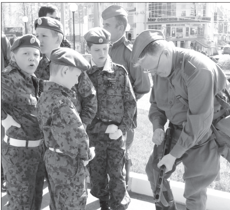
Так разбирается ППШ.