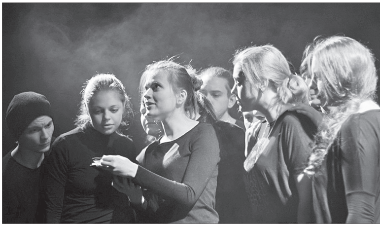
Сцена из спектакля «Белый пароход».

Играли молодые актеры с курса И. Калиновской. По новой моде, на заднике сцены на экране шли малопонятные кадры. Звучала опять-таки иностранная музыка. И даже