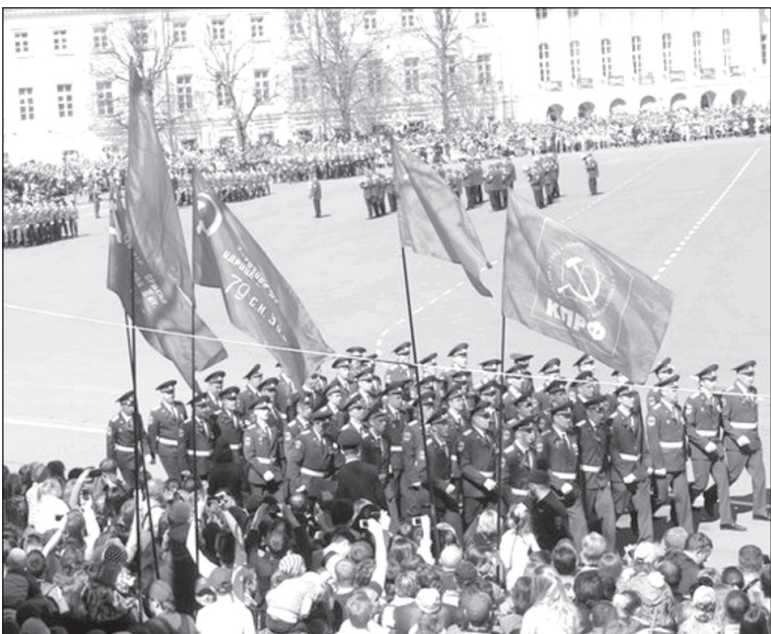
Флаги КПРФ реяли на Советской площади в час парада войск.