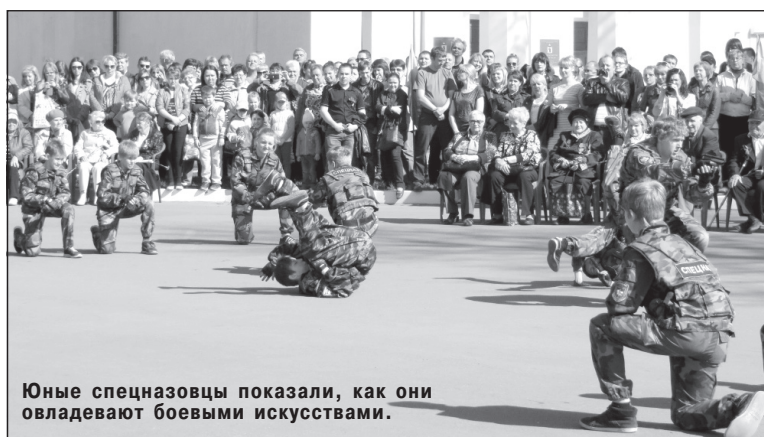
Юные спецназовцы показали, как они овладевают боевыми искусствами.