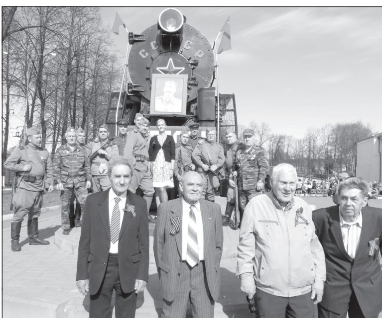
Ветераны ЯЭРЗ пожелали сфотографироваться у паровоза Победы.