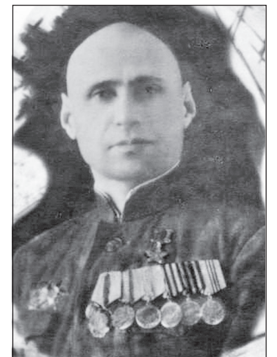
Герой Советского Союза Гордей Иванович Филиппов.

Одним из первых полк ворвался в Восточную Пруссию. Бешено сопротивляется израненный фашистский зверь. 28 марта 1945 года полк направляют в центральную Германию и готовят к штурму Берлина. В конце апреля полк получает боевое задание — создать непроходимый заслон на подступах к городу. В 35-40 километрах от Берлина артиллеристы огнем отрезают большую группировку противника, которая намеревалась прийти на помощь осажденным частям, находившимся в городе. Артиллеристы прямой наводкой били по живой силе и технике врага. Бои не прекращались в течение многих дней.