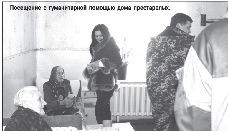
Посещение с гуманитарной помощью дома престарелых.

- Поначалу было непривычно. Потом привык. Не то, что мне это по душе или как-то нравится. Но выбора нет. С той стороны тоже стреляют. Мы вынуждены отвечать. Бывают одиночные бои, бывают крупные операции. В середине августа мы разбили колонну батальона «Айдар». Там, где Мельничук погиб, комбат их. Лично видел. Они отступали от Металлиста. Там есть дорога, мы на обочине сделали засаду, между Металлистом и Счастьем. Они по трассе вели танки, два БМП было, «Урал» с пехотой, несколько обычных машин. Мельничук как раз в одной из них ехал. Всего было 60 человек. Наши - 25. Техники у нас, конечно, не было. Только гранатомёты. Против танка гранатомёт бесполезен, если только не стрелять очень прицельно.