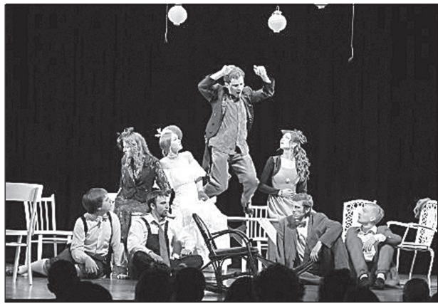
Сцена из спектакля «Мой милый Плюшкин».

Обидно было и другое. Студенты играли хорошо, замечательные голоса, да и чеховские