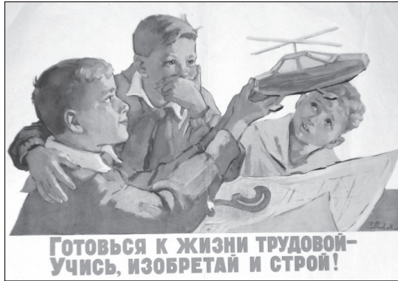
Плакат советского периода.

опасность для них вероятного массового народного возмущения, вызванного гнилью властного болота, ими же созданного вместе с партией «Единая Россия». Губернии поражены коррупционной сцепкой, кумовством депутатов-единороссов, местных правительств, правоохранительных органов и судов. И с этим надо что-то делать, поскольку Россия тонет в болоте коррупции.