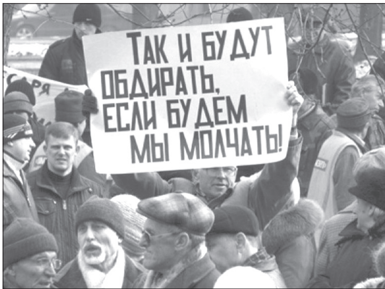
Акции протеста по тарифам ЖКХ становятся непрерывными, круглогодичными. Люди говорят: Повышай народу пенсию и зарплату, а потом – квартплату!