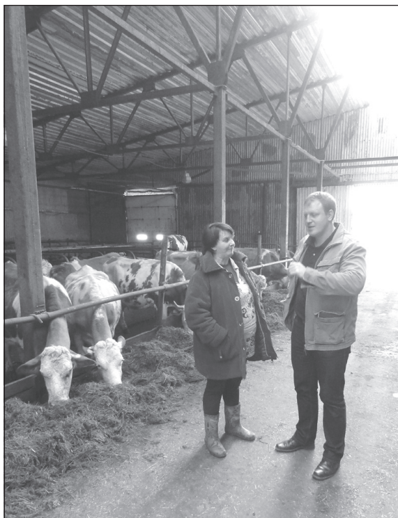
высказаны сомнения в том, что хозяйство в Курбе ведется эффективно и в соответствии с законом.

С позиции банка – его требования законны. Что в договоре написано, то и отдайте. Более того, со стороны сотрудников кредитной организации неоднократно были