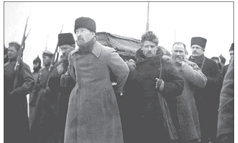
Ф.Э.Дзержинский - председатель комиссии по организации похорон В.И.Ленина.