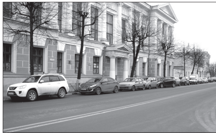
Ярославский городской Центр внешкольной работы.

В материале «Как ущемляются права детства» рассказывалось, какие же нарушения усмотрела районная прокуратура в детском учреждении? Оказывается, в трехэтажном здании, построенном в 1914 году под городское коммерческое училище и торговую школу, не были возведены пандусы и подъемные устройства (лифты). И наша бдительная прокуратура выявила это через 100 лет. И тут же проявилась полная некомпетентность ярославских правоохранительных органов. Проявилось отсутствие элементарных знаний об исторических памятниках богатейшей культуры Ярославля (в