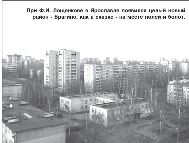
При Ф.И. Лощенкове в Ярославле появился целый новый район - Брагино, как в сказке - на месте полей и болот.