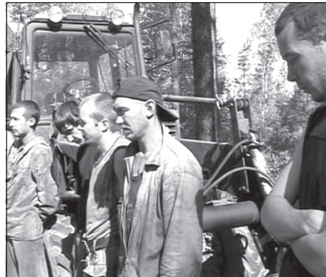
«Черные лесорубы» у поселка Никольск.