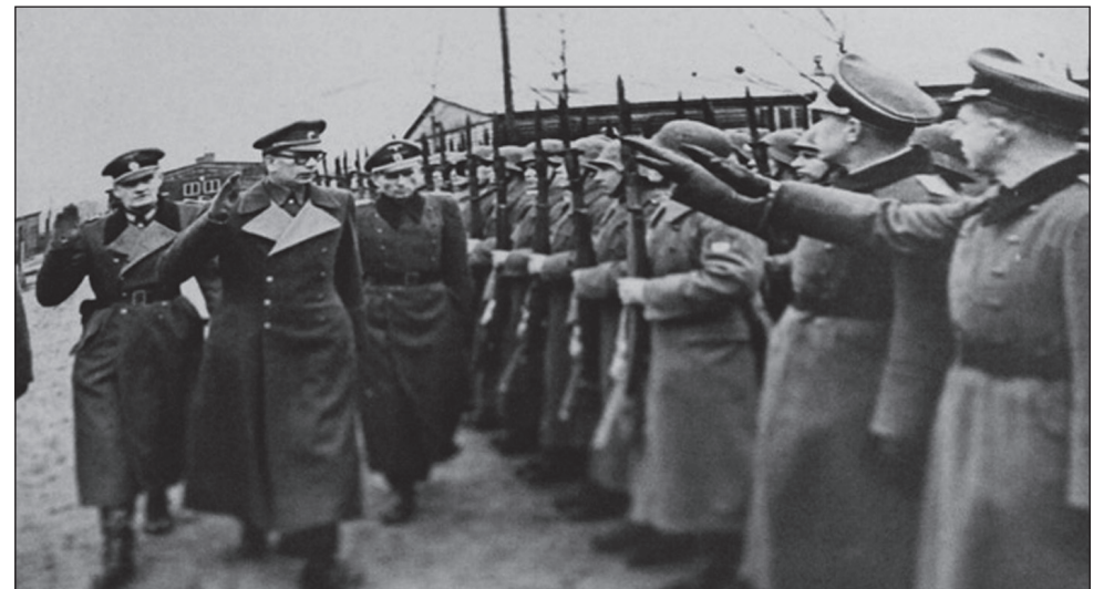
А.А.Власов и Ф.И.Трухин вместе с немецкими офицерами принимают парад частей РОА (г. Мюнзинген). 10 февраля 1945 г.