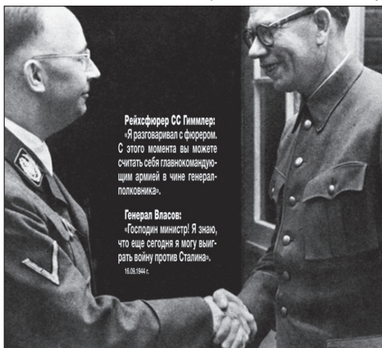
Рейхсфюрер СС Гиммлер и генерал Власов.

ОТВЕТ: В июле 1943 г. генерал белой армии Краснов заключил договор с генерал-фельдмаршалом Кейтелем и Розенбергом о том, что казаки обяза-