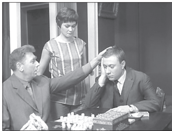
«Тебя посадят, а ты не воруй!»

У воруго оставался один выход: если воровали, то наворованное «откладывали» в золото. А золото было дорого, рыночная цена в 10 раз превышала себестоимость. И коль нечестный по натуре человек превращался все же в воруго, то,