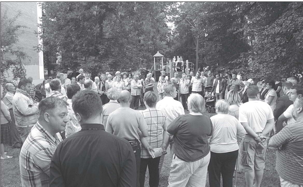
Сход жителей Бутусовского посёлка.