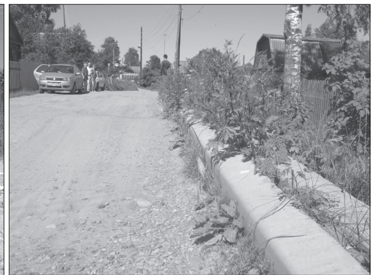
Песочное. Улица Ленинская.