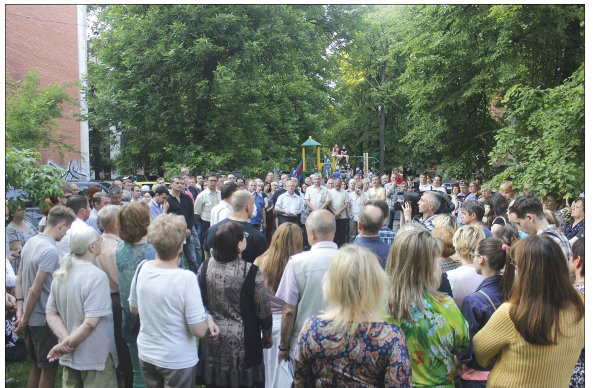
3 июня жители посёлка Бутусовский, что в центре Ярославля, вышли на сход. Он был посвящен недопущению строительства жилого дома на участке между домом №20 по улице Пушкина и Еврейским культурным центром.