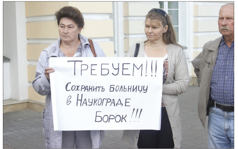
Жители посёлка Борок на митинге у областной Думы.

лет коммунисты поднимали проблемы с закрытием роддомов, больниц, боролись против проводимой «оптимизации» здравоохранения.