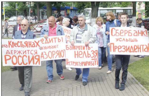
Митинг в поддержку сельхозпредприятия «Курба» у здания Сбербанка.

Я все столь подробно рассказываю про общепит советского периода, чтоб молодой читатель понял: во всех садиках и школах, во всех вузах, во всех учреждениях, организациях и заводах были столовые. И было диетпитание в производственных столовых. И были профсоюзные проверки в этих столовых. И обед был от 45 минут до 1 часа. Чоб ели «с толком, с чувством, с расстановкой». Чоб никакой тебе нервотрепки и хватания кусков на ходу... И главное - никакой остаточной пищи на второй день после готовки не оставалось. Позволялось перерабатывать только мясо на котлеты и оставлять кондитерские изделия. Все остальное после смены шло в отходы.