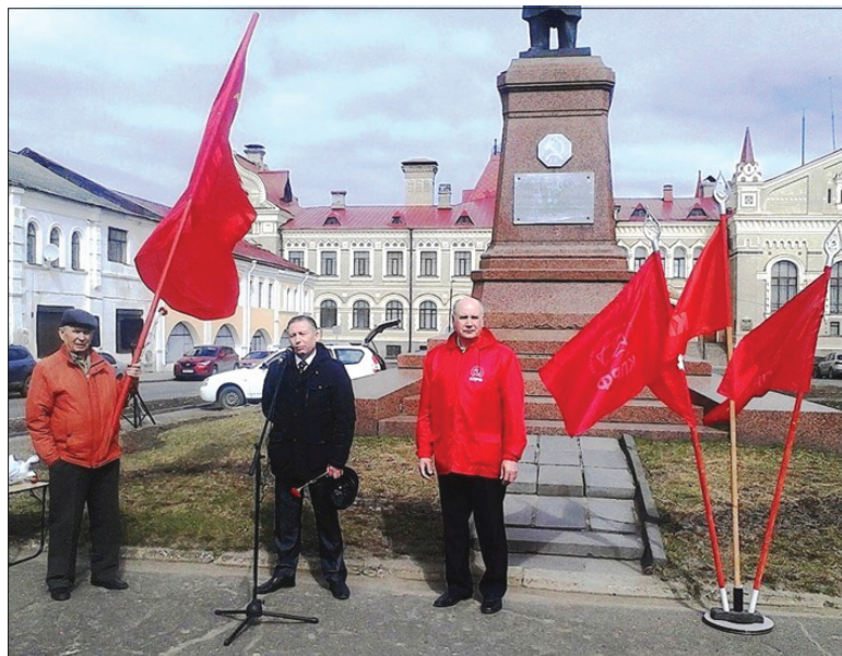
Митинг рыбинских коммунистов за прямые выборы мэра.

Пример - выборное законодательство о местном самоуправлении. То глав избирать, то назначать. То на освобожденной основе, то наоборот. То партийные списки, то беспартийные, и т. д. Или вот вам - сити-менеджер. Видимо, это происходит потому, что во всех муниципальных образованиях господствует одна партия - «партия денежного мешка» «Единая Россия».