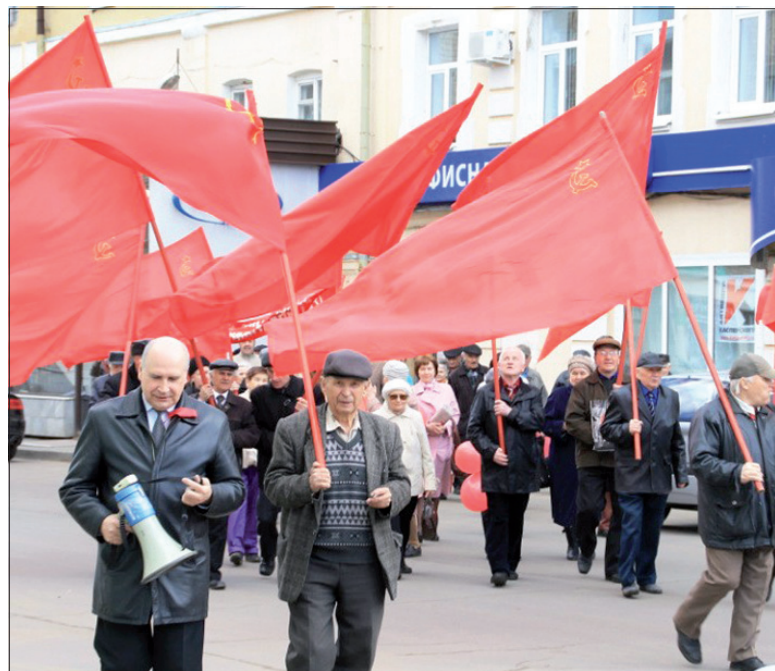
Рыбинские коммунисты против повышения тарифов ЖКХ.