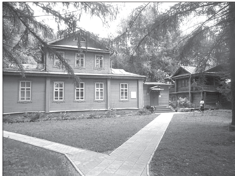
Дом, в котором создавалась ленинская книга, — центр усадьбы Ганшиных