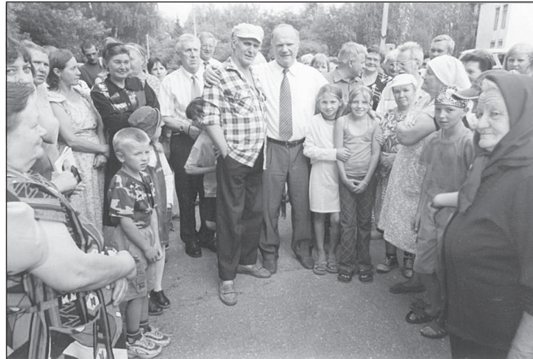
Г.А. Зюганов в Горках.

Райком имеет свой сайт в Интернете — kprf.pereslavl.ru. По своему возрасту он