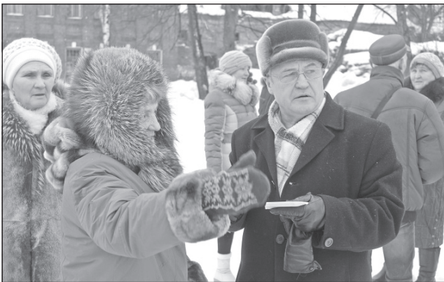
Перед тутаевцами выступил А.В. Воробьев.