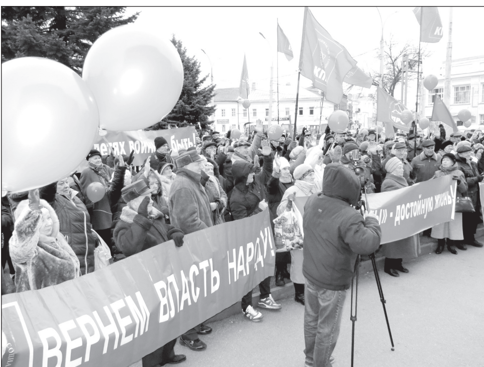
Участники митинга 7 ноября на площади Волкова в Ярославле голосуют за принятую резолюцию.