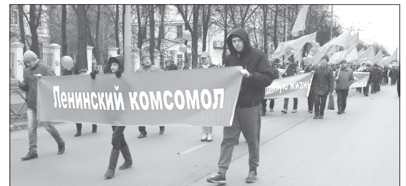
В колонне демонстрантов - ярославские комсомольцы.