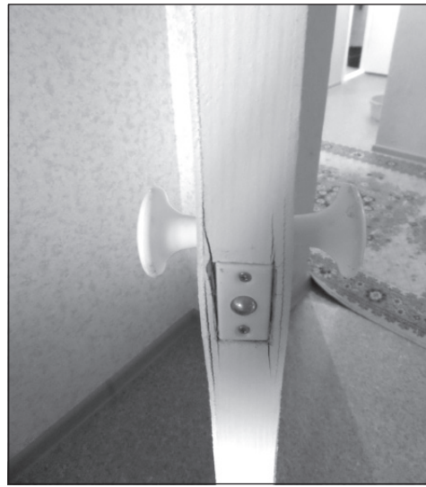
Вот такая некондиция - двери.

Вот и выходит, что выводы четвертого тома «Капитала» Маркса будто о нашей ярославской действительности — о сращивании органов