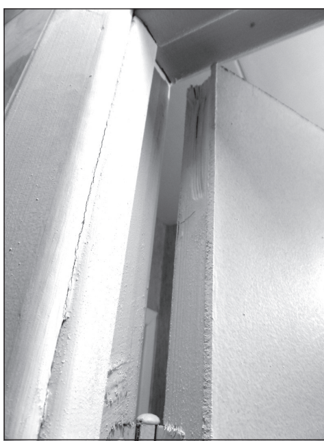
Вот такая «классная» некондиция устанавливалась в новых квартирах застройщика ООО «Брик».

Я обещала, что буду рассказывать читателям