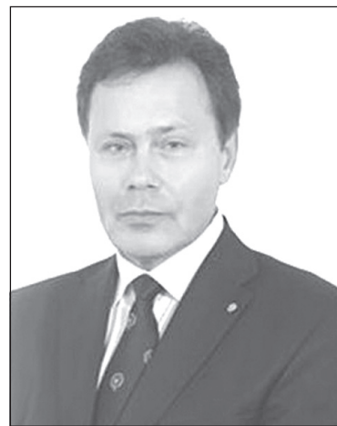
Николай Арефьев.

Заместитель председателя комитета ГД по экономической политике, инновационному развитию и предпринимательству Николай Арефьев (фракция КРПФ):