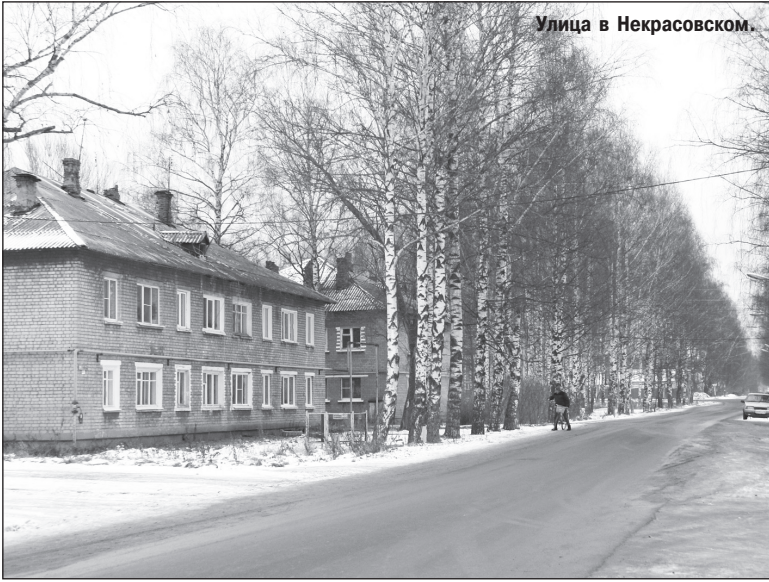
Улица в Некрасовском.