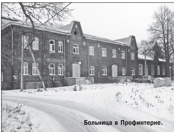
Больница в Профинтерне.

молока – меньше, чем два хозяйства. Почти не занимаются картофелеводством, которым всегда славились некрасовские места. Проседает льноводство.