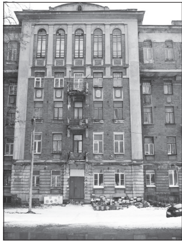
Дом 17 на набережной.

Среди других проблем, которые необходимо решать, — опилковка деревьев, вывоз мусора, капитальный ремонт домов. Последняя задача особенно актуальна. Сейчас основное бремя ложится на людей. Но средств граждан катастрофически не хватает, чтобы привести дома в нормальное состояние. Поэтому нужно значительно увеличить долю областного бюджета на эти цели, что давно предлагает