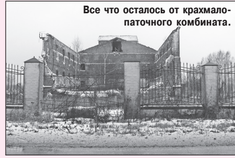
Все что осталось от крахмало-паточного комбината.

В результате сегодня Некрасовское местное отделение КПРФ – одно из самых сильных в области. Это сплочённая команда единомышленников, которая ведёт непростую работу на благо родного района и у которой есть чёткий и понятный план, как сделать жизнь некрасовцев лучше. Об этих людях и этой работе – наш сегодняшний рассказ.