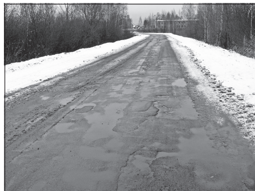
Плохая дорога на Заболотье.

Переправа соединяет две части района и без преувеличения является стратегическим объектом. Вместе с тем вопросы по её организации фактически переложены на сельские поселения Красный Профинтерн и Некрасовское, которые не обладают необходимыми средствами. Но и в районе денег на работу по содержанию и обслуживанию переправы крайне мало. Оттого проблема её нормального функционирования находится в «подвешенном состоянии». Особенно в осенне-зимний период. А «скорая», полиция, другие службы, да и многие жители вынуждены ездить через Ярославль, «наматывая» десятки лишних километров. Поэтому и поселениям, и району необходимо жёстко ставить перед правительством области вопрос о выделении субсидий на организацию работ на переправе. Притом в полном объеме, а не по остаточному принципу.