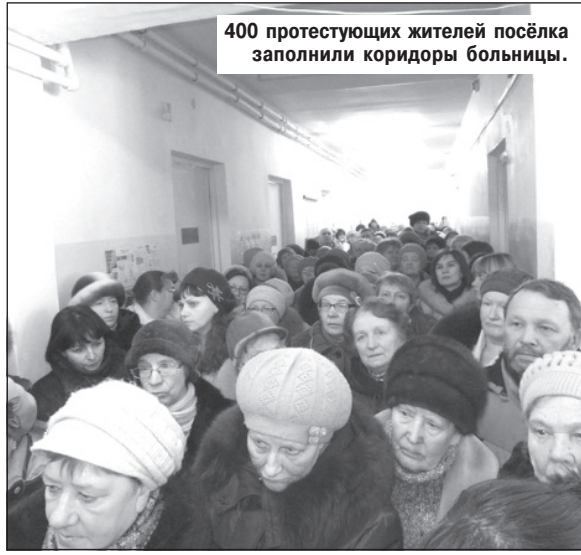
400 протестующих жителей посёлка заполнили коридоры больницы.

На неформальный призыв участвовать в мероприятии откликнулось практически все население посёлка. Пришли сотни людей, которые заполнили все коридоры поликлиники. Число участников называют примерно 400 человек, хотя это может быть и большая цифра, так как многие физически не смогли войти в помещение поликлиники, оставались на улице, и после получасового ожидания просто ушли. Вошедшие же в больницу также чего-то ожидали. Однако по цепи участников сначала прошла команда «ждите», а потом «расходитесь». Телевизионщики от самых различных телеканалов сбились снимать сверху толпу, хотя это было непросто.