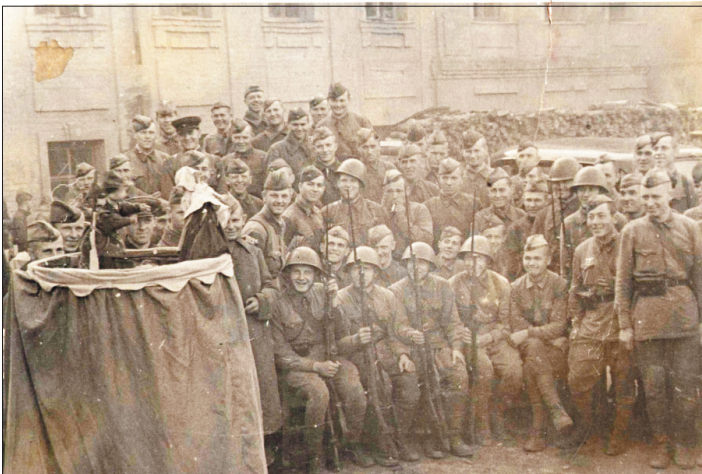
Кукольный театр Дворца пионеров в гостях у красноармейцев. 1941 год.