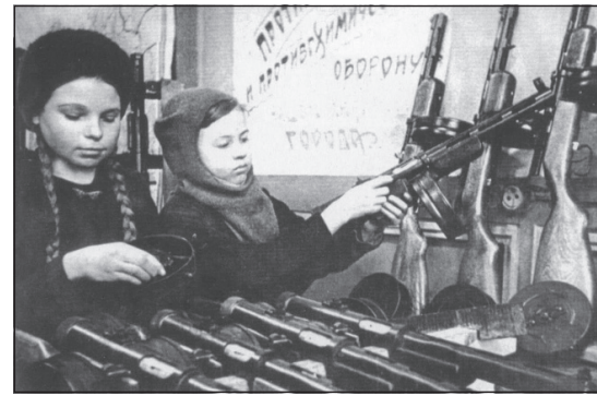
Сборка автоматов. Дети помогают фронту.

А через два года за большую работу по коммунистическому воспитанию детей Всесоюзная пионерская организация им. В.И. Ленина была награждена высшим орденом страны – орденом Ленина. Есть в этом вклад и ярославской пионерии. Сотни тонн металлолома были собраны ребятами и отправлены на переработку. Из них в Ярославле изготавливались двигатели для большегрузных автомобилей и мощных тракторов, на