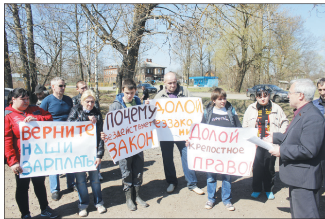
Работники ОАО «Курба» вышли на протест.

особенно возмущает тот факт, что всё делается внаглую. Работы начались без публичного обсуждения и каких-либо согласований с жителями.