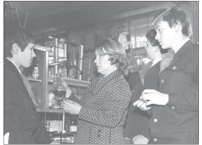
В химической лаборатории.