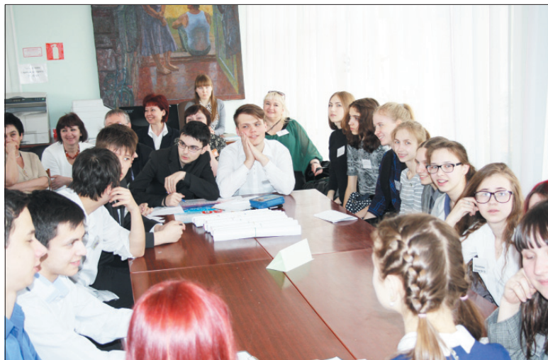
Участники интеллектуального ринга.