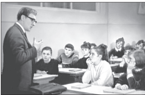
Кадр из фильма «Доживём до понедельника».

двум учебникам ("История России" и "Всеобщая история" 20 века). Учитель Чапаева до темы «Вторая мировая война» работала только по учебнику "Всеобщая история", не было нормального изучения гражданской войны, при изучении «Тихого Дона» Шолохова на уроках литературы у ребят были большие проблемы. Не изучались нормально Первая мировая