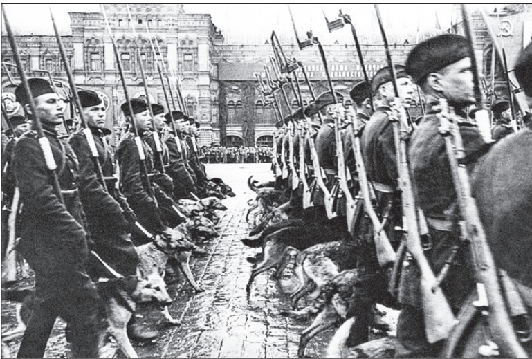
(Окончание. Начало на стр. 1)

На парад предполагалось вывести десять сводных полков фронтов и сводный полк Военно-Морского Флота. К участию в нем привлекались также слушатели военных академий, курсанты военных училищ и войска Московского гарнизона, а также военная техника, в том числе авиация.