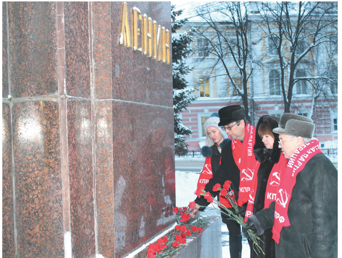
21 января партийный актив г. Ярославля и сторонники коммунистов на Красной площади города возложили цветы к памятнику В.И.Ленина.