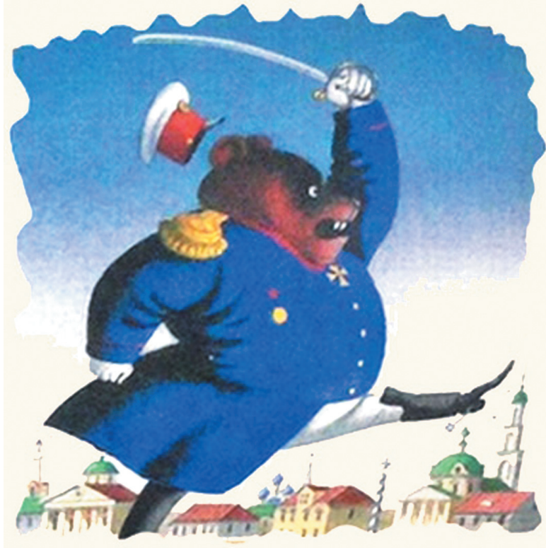
Иллюстрация к сказке «Медведь на воеводстве».

«Бывый» денщик Фердыщенко «при не весьма обширном уме, был косноязычен». Добившийся градоначальничества «самого продолжительного и самого блестящего», Бородавкин «спалил тридцать три деревни, и с помощью сих мер взъяскал недоимок два рубля с полтиной». Работавший прежде истопником Негодяев «разместил вымощенные предшественниками его улицы, из добытого камня настроил монументов». «Потомок сладострастной княгини Тамары» Микаладзе «был столь охоч до женского пола, что увеличил глуповское население почти вдвое» и умер «от истощения сил». Склонный к законодательству Беневоленский сочинил городской «устав» со следующим пунктом: «Просвещение внедрять, по возможности избегая кровопролития». У майора Прыща оказалась голова «фаршированной», а «план» правления «заклучался в одном: «отдохнуть-с!» Маленький ростом Иванов «не вмещал пространств законов». Выходец из Франции Дю-Шарио «любил рядиться в женское платье и лакомиться лягушками». Чувствительный Грустилов «не мог без слез видеть, как токует тетерева». «Прохвост» Угрюм-Бурчеев разрушил город и построил другой на новом месте», а Перехват-Залихватский «въехал в Глупов на