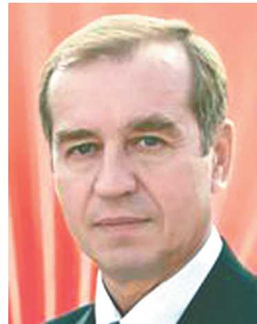
ЛЕВЧЕНКО Сергей Георгиевич - член Президиума ЦК КПРФ, первый секретарь Иркутского обкома КПРФ, депутат Государственной Думы ФС РФ.

Во-первых, практически в режиме реального времени знакомить посетителей с деятельностью самого