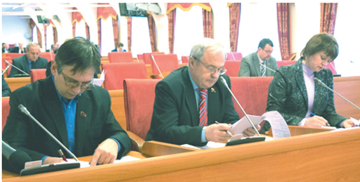
Депутаты фракции КПРФ в Ярославской областной думе.