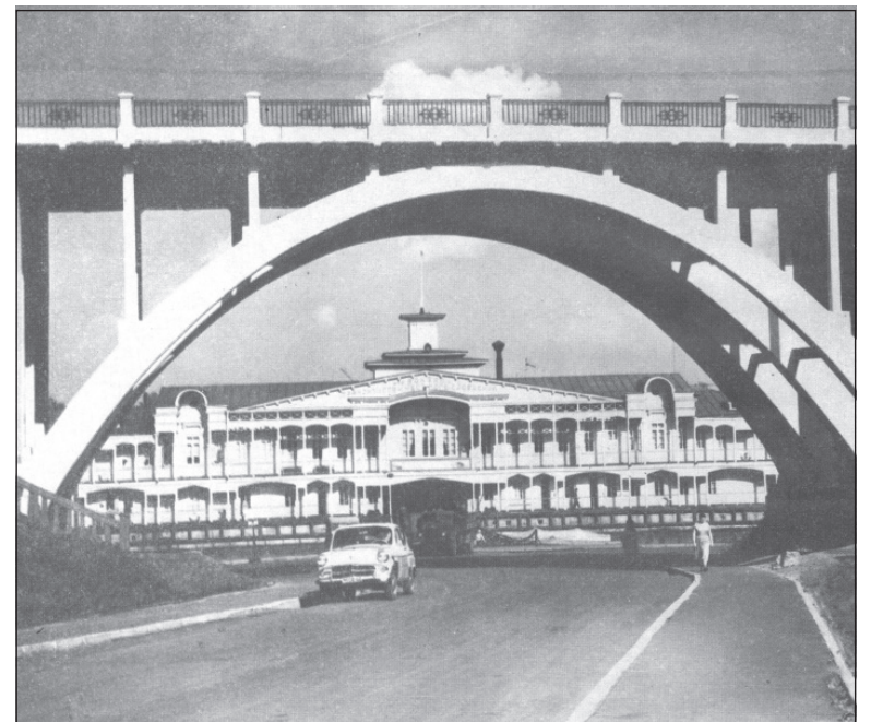
Речной вокзал Ярославля (снимок из альбома).

Здесь пытливые мальчишки и девчонки приобретали новые знания, умения и навыки. А мы, глядя на фотографии прошлого, теперь имеем возможность познакомиться с делами, которыми жили наши предки.