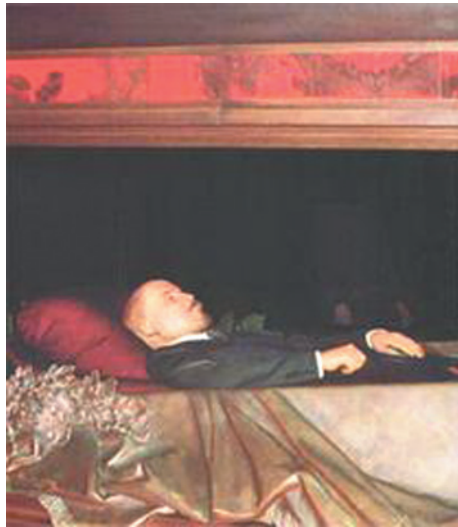
Саркофаг с гробом Ленина в склепе под Мавзолеем.

Как видим, в случае с шумом вокруг формы захоронения Ленина налицо политическое лукавство, прикрытое некоторыми псевдорелигиозными заклинаниями.