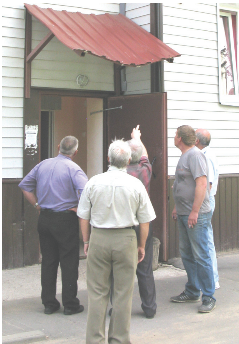
Громко разрекламированный на всю область дом на улице Центральной, 2-а, в Тихменевском поселении, построенный по программе аварийного жилья одним из первых в регионе, стоит всего несколько лет, но уже сейчас находится в ужасном состоянии.