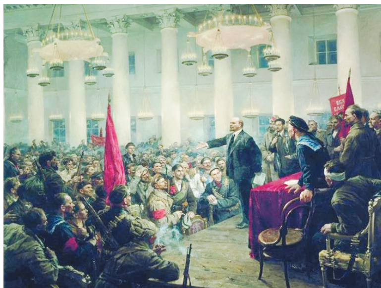
Выступление В.И. Ленина на II съезде Советов. Художник В.А. Серов.

Вместо белогвардейского лозунга «единой и неделимой России», который оказался нереализуем в условиях разгулявшегося в годы гражданской войны национал-сепаратизма на Украине, в Польше, Закавказье, Средней Азии и в других местах, Ленин предложил свой: «Всем народам собраться в «Республику Советов и Труда». Тем более, что на каждой территории национальных окраин находилась довольно энергичная и авторитетная, сплоченная и преданная идеалам тру-