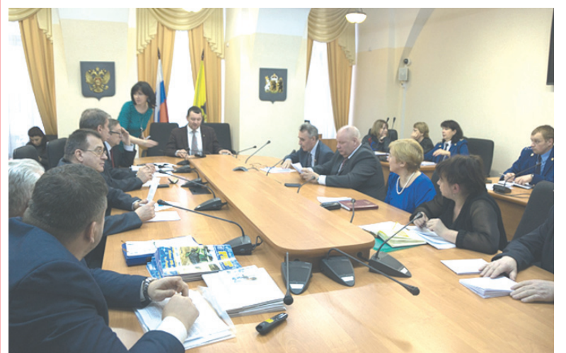
На заседании комитета.