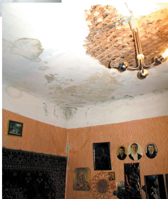
Квартира в доме.