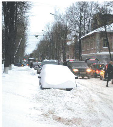
Ярославль, ул. Некрасова.

Глава Кировского района Бело-зёров в ходе прямого эфира «на голубом глазу» говорит, что в Кармановском всё убрано. А на