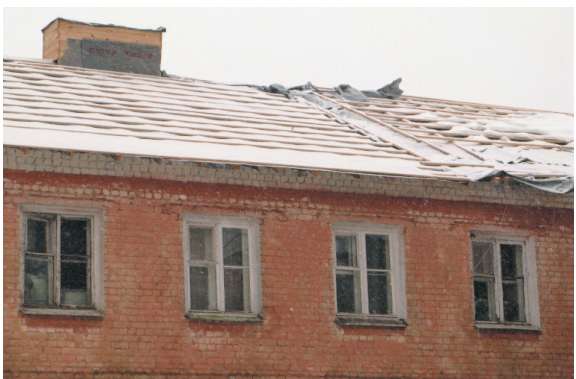
Февраль 2016 года. Дом стоит фактически без крыши.

На днях довелось посетить «счастливицков» капитального ремонта 2015 года. В бывшем военном городке (г. Рыбинск, ул. Горького, д. 51).