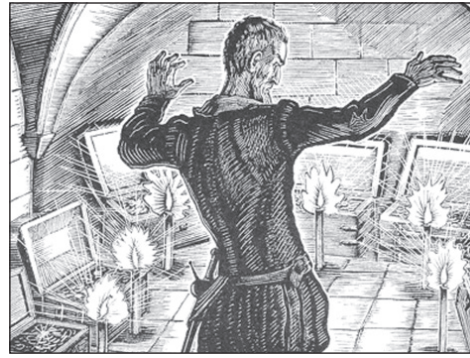
«Там Центробанк над златом чхнет...» Иллюстрация Владимира Фаворского к трагедии А.С. Пушкина «Скупой рыцарь».

Вслед за сжатием кредита у предприятий сокращается оборотный капитал и свертываются инвестиции, что мы и наблюдаем по показателям падения ВВП и инвестиций в основной капитал. Те же предприятия, которым рынок позволяет поднять цены, вынуждены это делать, чтобы переложить на потребителей рост издержек на оплату процентов за кредит — так раскручивается инфляция. Вот мы и оказались в стагнационной ловушке: задрал ключевую ставку вдвое выше рентабельности производственной сферы, ЦБ переключил денежные потоки в экономике на финансовый рынок, в котором стал быстро вздуться валютный сегмент. А после того как он ушёл с валютного рынка, бросив курс рубля на произвол