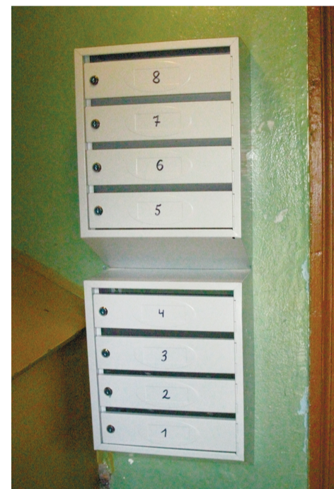
На фото – новые почтовые ящики, установленные в домах №16, 18, 20 на проезде Шавырина на основании обращений избирателей к депутату.

элементов оснащения. К примеру, оконных блоков или почтовых ящиков.