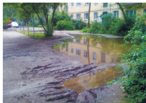
К примеру, на фото – двор дома №32 по Ленинградскому проспекту до и после ремонта.

удалось включить в муниципальную программу комплексного благоустройства дворов и внести поправки о выделении необходимых на эти цели средств в городской бюджет.