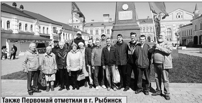
Также Первомай отметили в г. Рыбинск