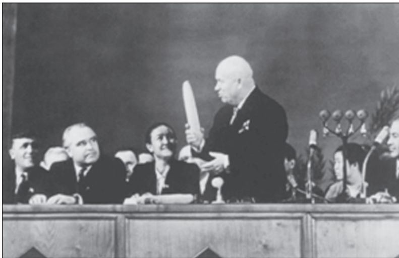
Хрущев и кукуруза.

Например, предпринятая им критика культа личности Сталина на XX Съезде КПСС в феврале 1956 года обусловлена не столько стремлением разобраться в причинах возникновения данного феномена и покончить с ним раз и навсегда в политической жизни Партии и государства, сколько приобрести определённую популярность в обществе. Н.С. Хрущев построил свой доклад исключительно на жесткой критике деятельности Сталина, и особенно его вины в репрессиях в 30-х годах, полностью умалчивая о своем активном участии в них. В такой постановке вопроса, на наш взгляд, заключался следующий посыл.