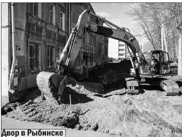
Двор в Рыбинске

Нынешней весной погода пока благовоит строительно-ремонтным работам. Апрель выдался на редкость тёплым и достаточно сухим. Поэтому в муниципальных образованиях региона, где уже провели конкурсные процедуры и подписали контракты, подрядчики приступили к работам. К сожалению, Ярославль вновь не в передовиках. По крайней мере, в части благоустройства дворов и игровых площадок. К началу последней рабочей недели второго весеннего месяца в областном центре заключили всего два договора. А часть объектов и вовсе находится в экспертизе. Между тем, работы нужно завершить до 1 августа. А надеяться на бесконечную милость природы не приходится.