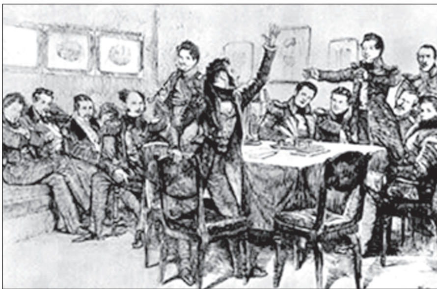
А.С. Пушкин читает свои стихи на одном из тайных собраний декабристов.