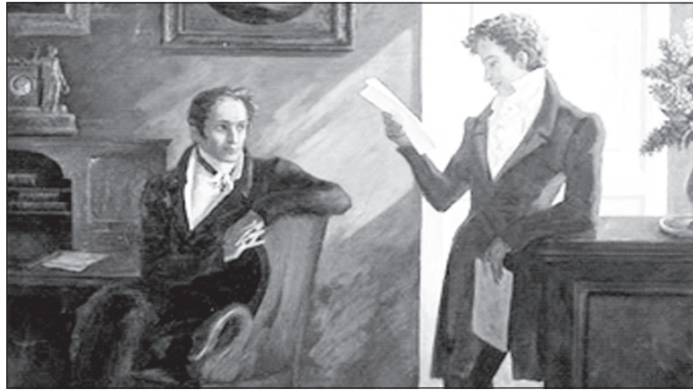
Юноша А. Пушкин и Н.М. Карамзин.

Н.М. Карамзину было интересно беседовать с Пушкиным и его друзьями-лицеистами, как представителями