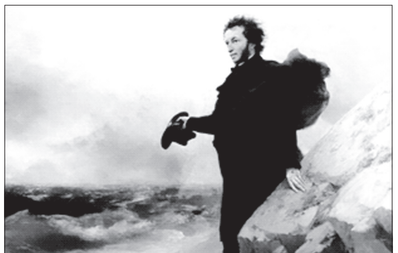
И.К. Айвазовский, И.Е. Репин "Прощание Пушкина с морем". ("Прощай свободная стихия..."). 1887 г. Айвазовский знал свою слабость в портрете и сам пригласил Репина написать Пушкина. Позднее Репин так отозвался о совместной работе: "Дивное море написал Айвазовский (...) И я удостоился намалевать там фигурку Пушкина".