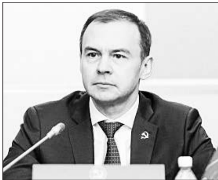
Первый заместитель Председателя ЦК КПРФ Юрий Афонин прокомментировал данные свежего социологического исследования об отно-

шении жителей России к возможной отмене ЕГЭ.