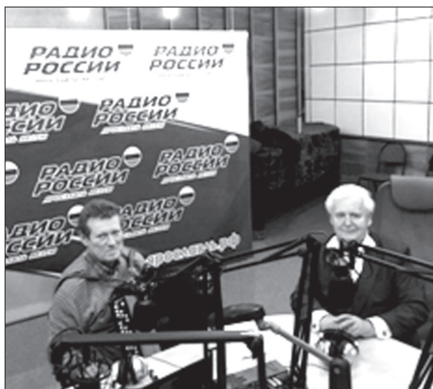
26 октября 2018 г., по случаю столетия Комсомола, выступление в прямом эфире на Ярославском областном радио. Аккомпанирует радиожурналист В. Болонкин.

Корреспондент: Кто дал такое замечательное и в то же время трогательное название дуэту "Душа в душу"?