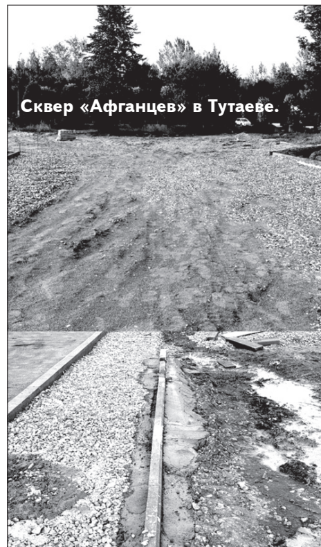
Сквер «Афганцев» в Тутаеве.