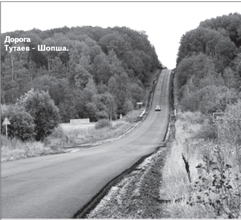
Дорога Тутаев - Шопша.